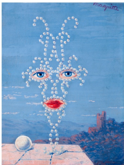
Рене Магритт. Шварцара. 1947.