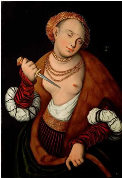
Лукас Кранах Младший. Лукреция.

И все-таки о том, с чего все начиналось и что больше всего ценилось семейством Йонкхере с первых дней ведения галерейного бизнеса, говорит даже сама планировка пространства De Jonckheere Монако. Сердцем ее стали уводящие в глубину здания залы старых мастеров. Здесь можно посмотреть на такие жемчужины, как «Речной пейзаж с видом на Антверпен» Яна Брейгеля Младшего, «Лукреция» Лукаса Кранаха Младшего, «Свадебная процессия на фоне сельского пейзажа» Питера Брейгеля Младшего. А художники XX–XXI веков расположились у самого выхода, так что, например, знаменитые «мобили» Александра Колдера можно увидеть даже не заходя внутрь, через огромные панорамные окна.