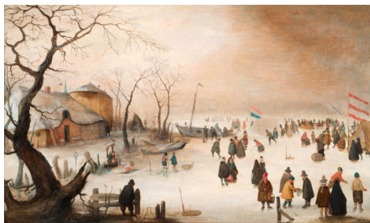
Хендрик Аверкамт. Зимний пейзаж с горожанами и конькобежцами. 1610-е.

Семья Йонкхере отмечает 40-летие своей деятельности в сфере искусства открытием первой в Монако галереи, специализирующейся на Северном Возрождении