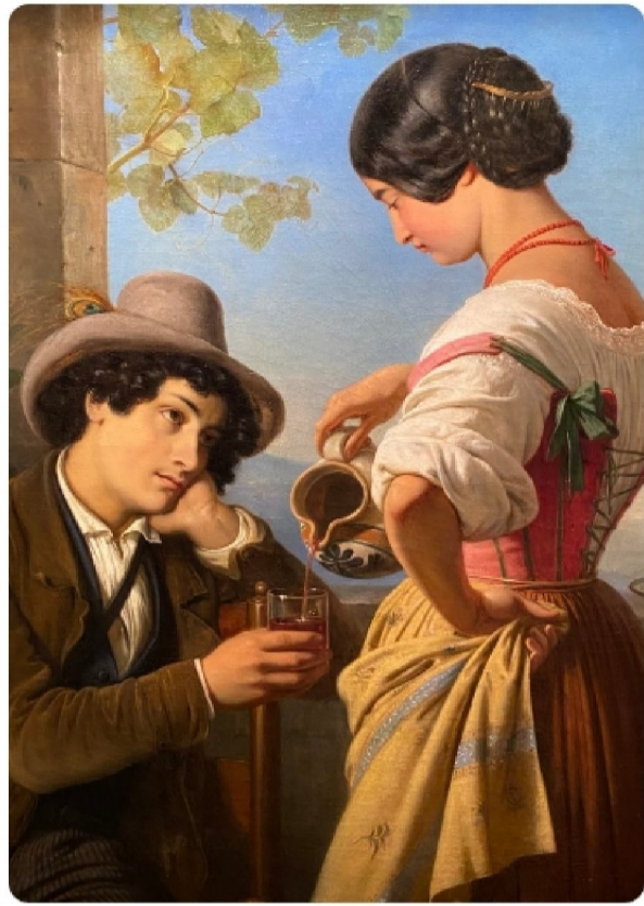
Marc Chagall (1887-1985), « Les fiancés au cirque », 1982. Wilhelm Marstrand (1810-1873), « Le repos du chasseur », 1850

Info : BRAFA ART FAIR. Du dimanche 26 Janvier au dimanche 2 Février 2025. Brussels Expo- Palais 3 & 4 -Place de la Belgique 1 à 1020 Bruxelles. www.brafa.art - Possibilités de visites guidées en FR, ENGL et NL. Conférences et workshops organisées par le Royal Institute for Cultural Heritage- Tel : 0032(0)2.513.48.31.