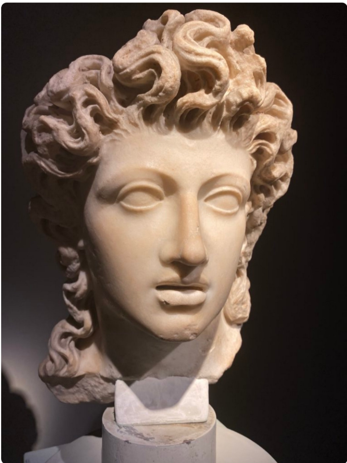
Tête masculine hellénistique, marbre, période antonine environ II e siècle après JC. (420 000 €)

Une explosion de couleurs et d'extravagance dans l'éternelle grisaille de Bruxelles ! Quelle ivresse de croiser l'invitée d'honneur de la Brafa 2025. Et quelle énergie cette artiste portugaise- figure incontournable de l'art contemporain-dégage dans sa gestuelle, son regard, ses mots et ses créations. De quoi nous redonner le moral en ces longs mois d'hiver sans lumière...Sculptures monumentales et installations immersives pleines d'humour et de couleurs vives explorent des thématiques passionnantes sur lesquelles méditer: statut de femmes, société de sur consommation, identité collective.