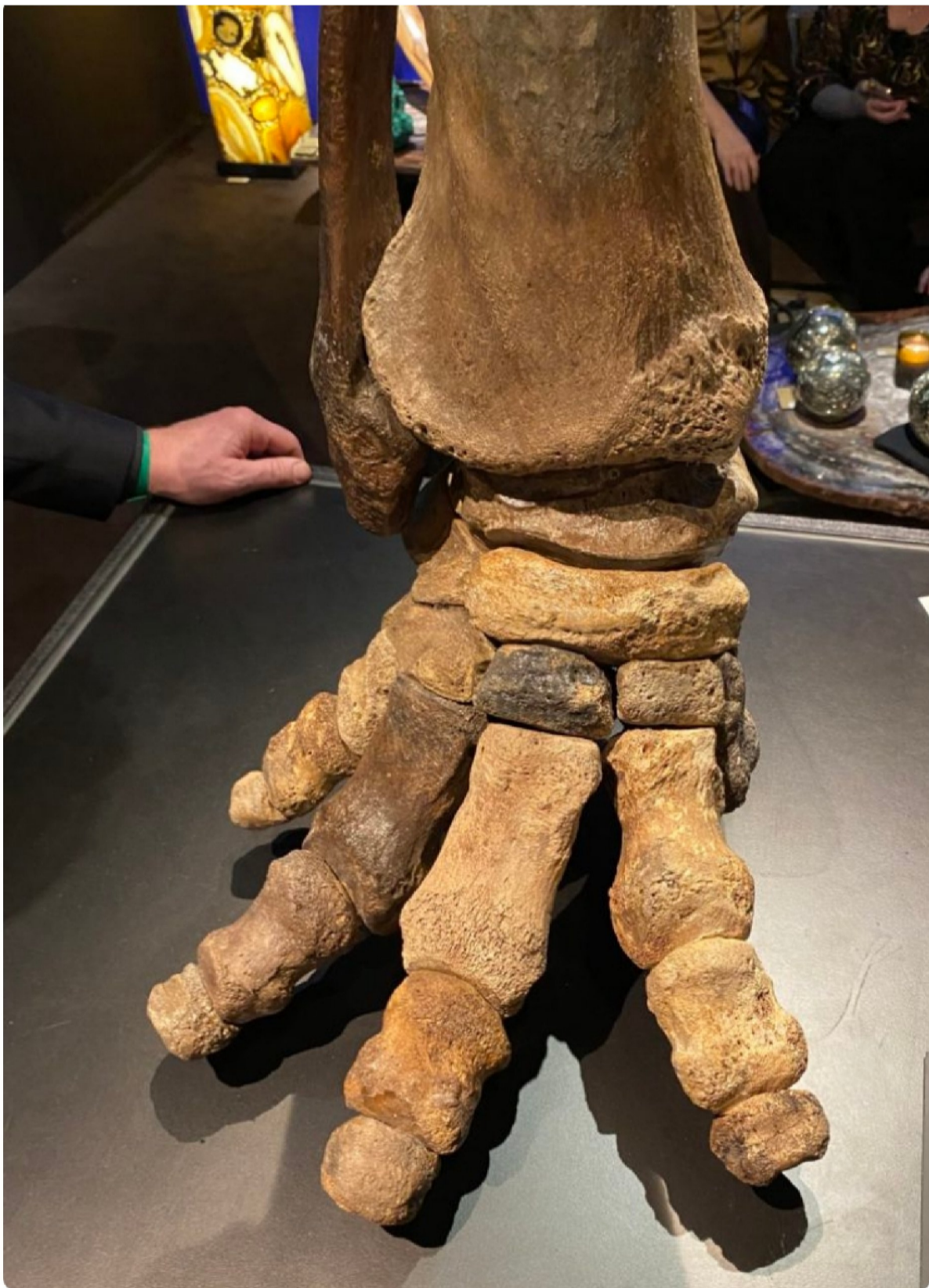
Patte de mammouth laineux, 50 000 ans, originaire de la Mer du Nord, Pays-Bas. (110 000 €)