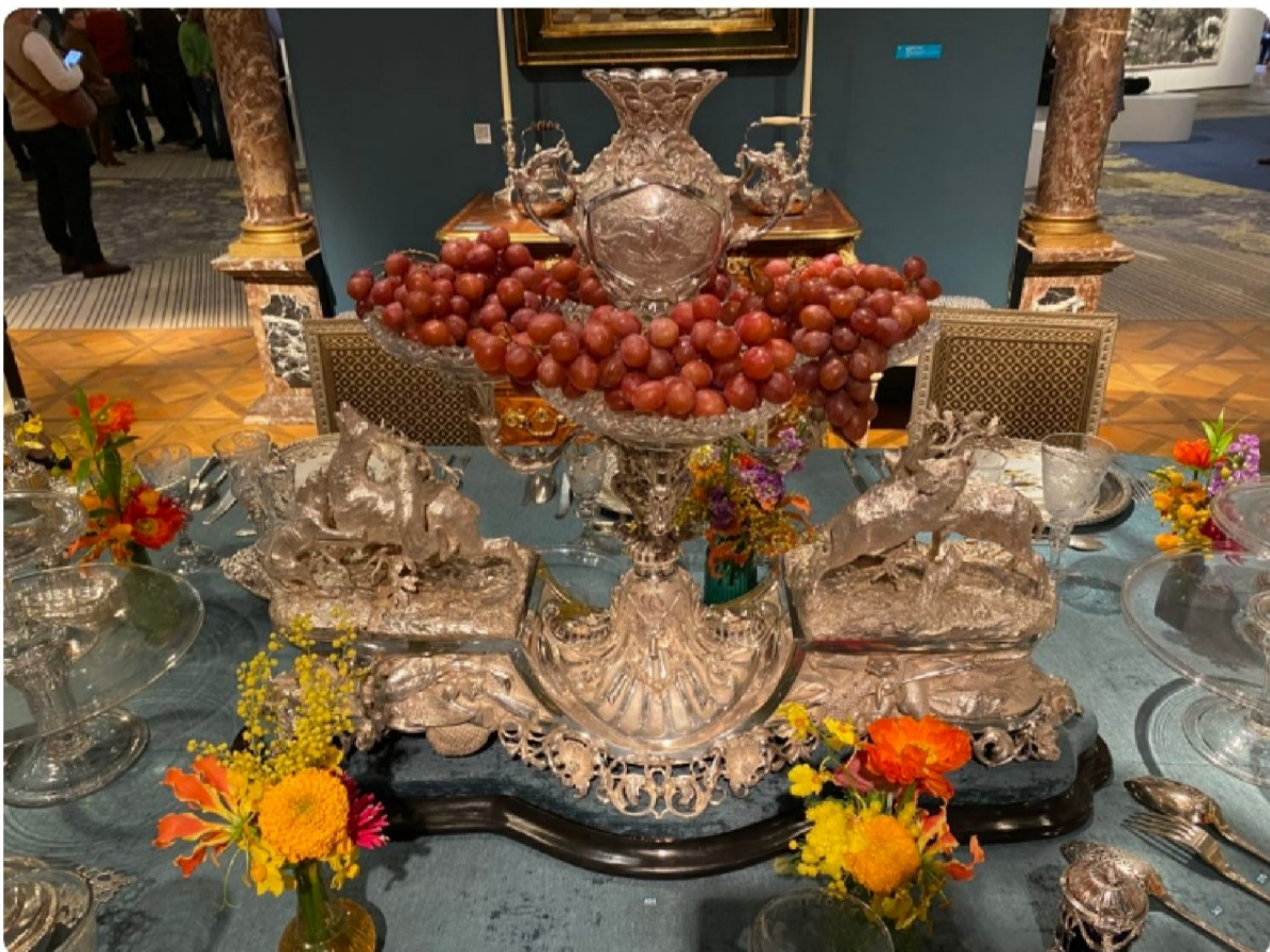
Surtout de chasse et de pêche en argent offert par SAR le comte de Flandres en 1864 à Monsieur Clément Xhoffray Grand Ry, en souvenir des chasses de la forêt de Hertogenwald. Maître orfèvre belge Dufour et Frères. Décoration: Gerald Watelet

Info : BRAFA ART FAIR. Du dimanche 26 Janvier au dimanche 2 Février 2025. Brussels Expo- Palais 3 & 4 -Place de la Belgique 1 à 1020 Bruxelles. www.brafa.art - Possibilités de visites guidées en FR, ENGL et NL. Conférences et workshops organisées par le Royal Institute for Cultural Heritage- Tel : 0032(0)2.513.48.31.