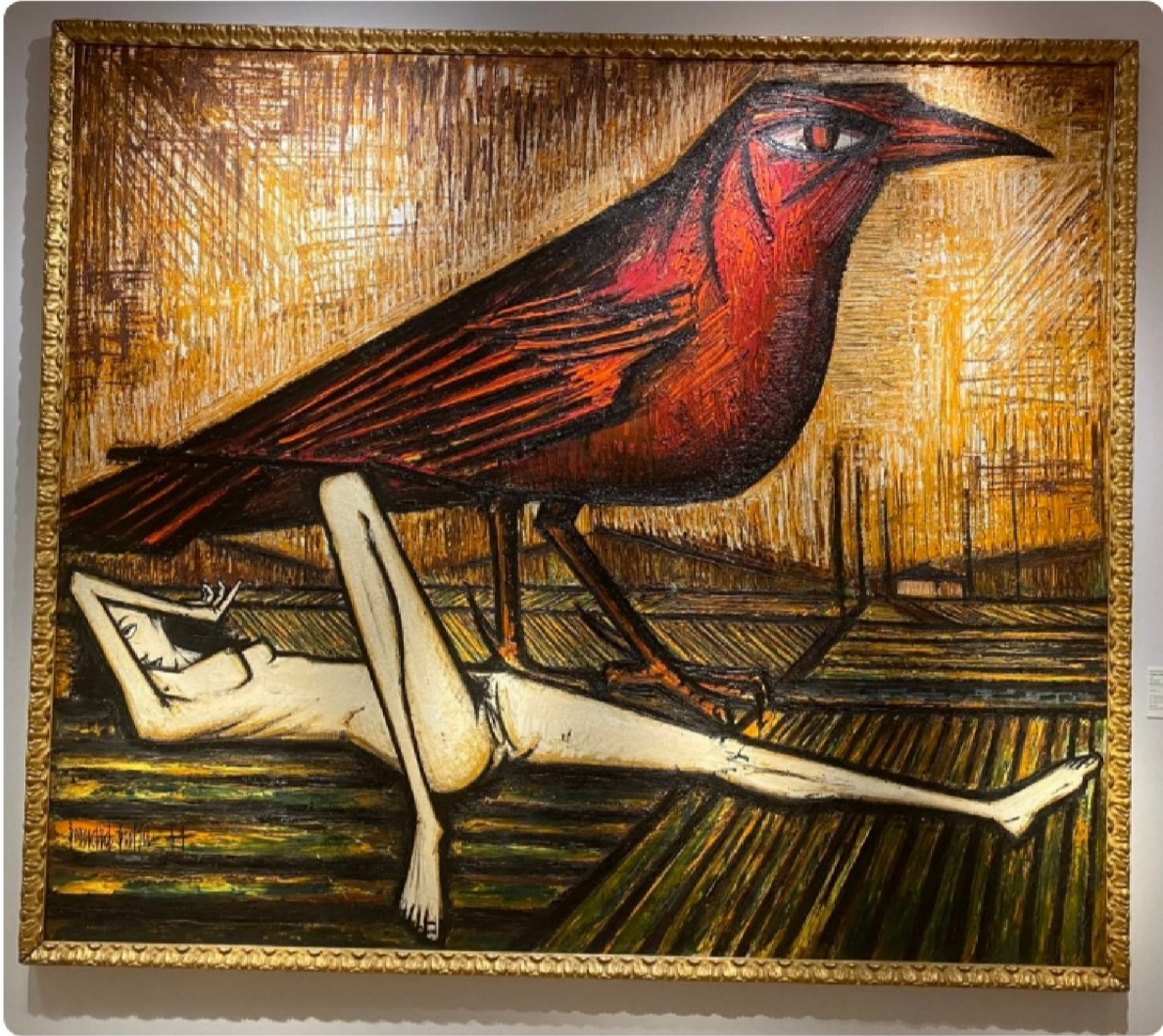
Bernard Buffet (1928-1999), « L »Oiseau rouge », 1959. Monumentale huile sur toile de 241 x 282 cm. (1 650 000 €)