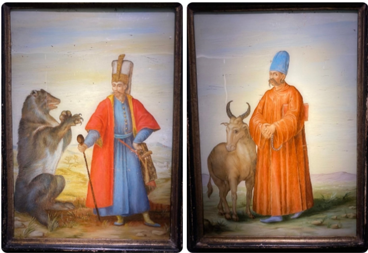
Attribué à Jacopo Ligozzi (1547-1627), « Janissaire et l'ours », et « Homme au chapelet », peintures sur verre inversé, vers 1617/1620

Au-delà de celles-ci, c'est l'âme profondément nostalgique du Portugal qu'elle désire mettre en lumière via le fado et autres arts populaires de son pays. L'on est conquis, dès les portes franchies de la Brafa, par ce ton joyeux et festif qui se propage en nous et partout, comme par magie. Le regard se pose directement sur la monumentale création réalisée par l'artiste. Au total, 4 œuvres sont à découvrir dans divers endroits stratégiques de la foire...