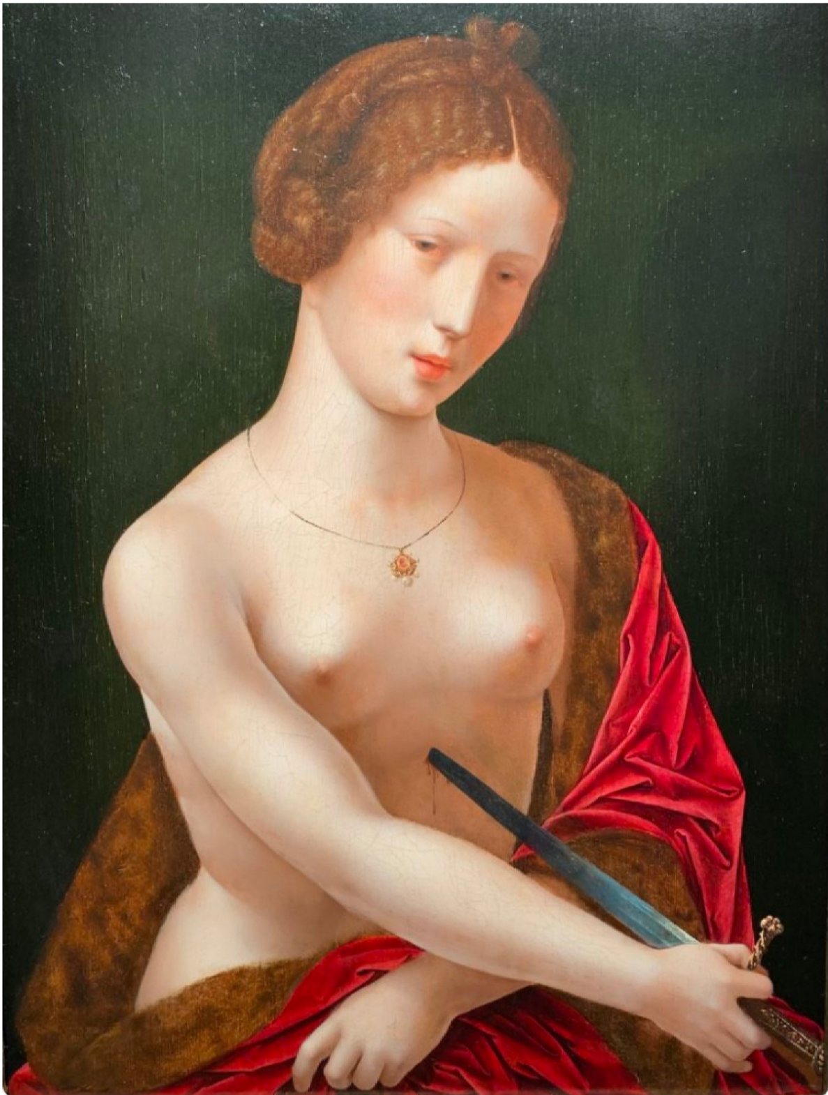
Maître des demi-figures, actif à Anvers entre 1500 et 1530, « Lucrèce »