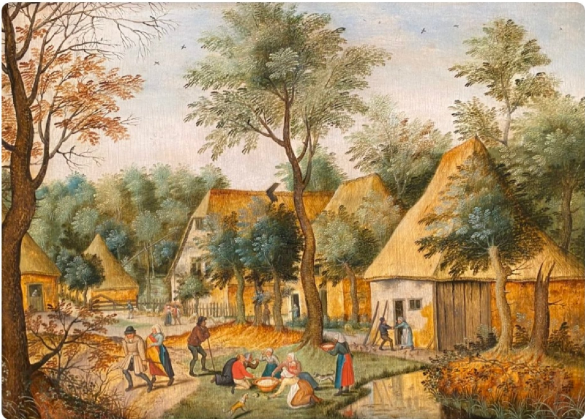
Pierre Brueghel le Jeune (1564-1638), « La Fête au village des paysans »